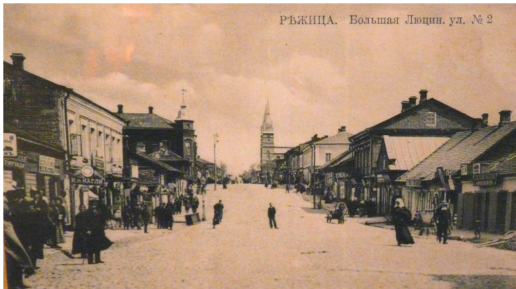
Rēzekne / Rzeżyca, fotografia z przełomu XIX i XX wieku