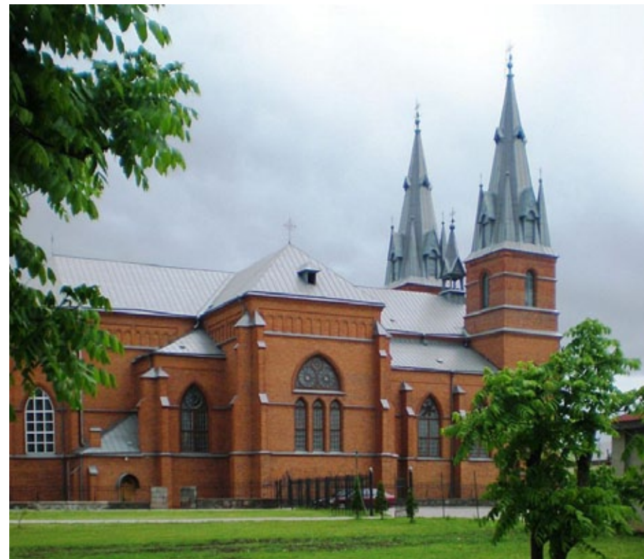
Katedra Najświętszego Serca Jezusowego w Rzeżycy, 1887–1902, projekt: Florian Wyganowski