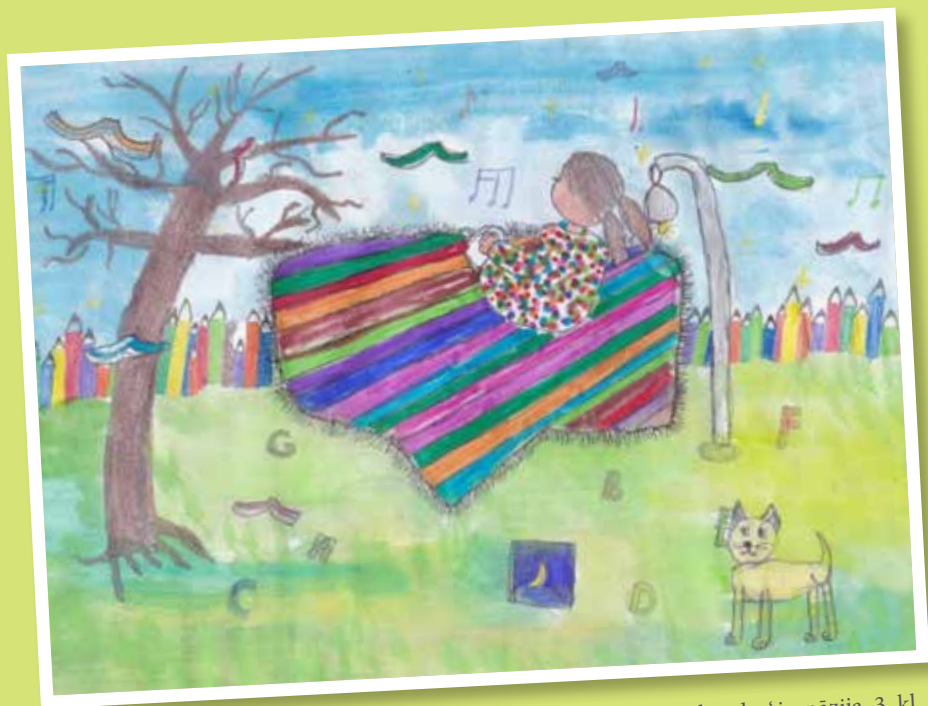
DENĪZE VALAINE, Aglonas katoļu ģimnāzija, 3. kl.