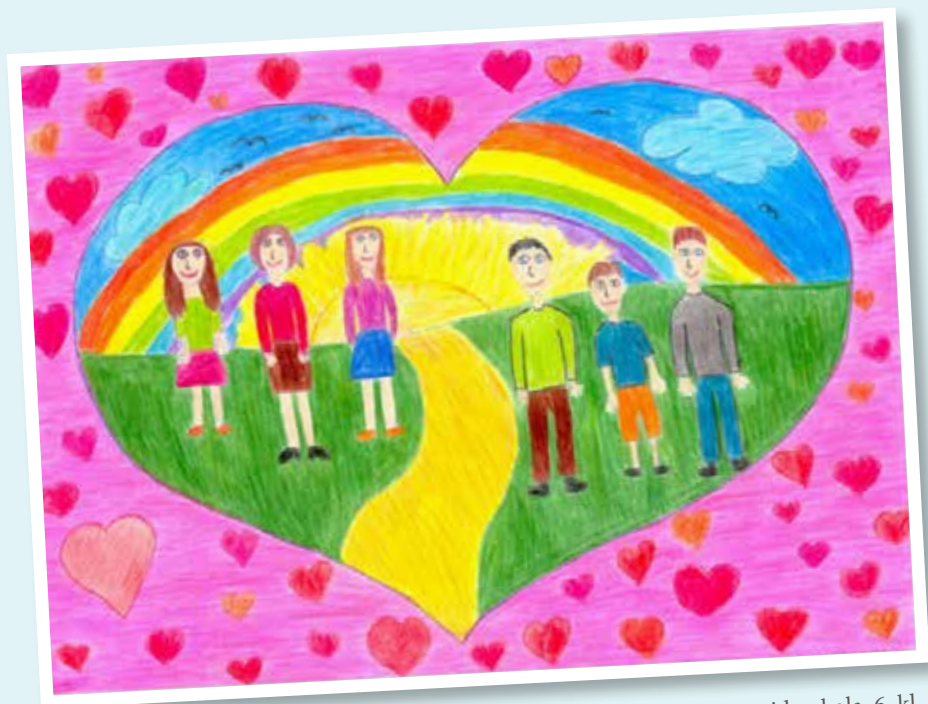
KATRĪNA VALAINE, Aglonas vidusskola, 6. kl.