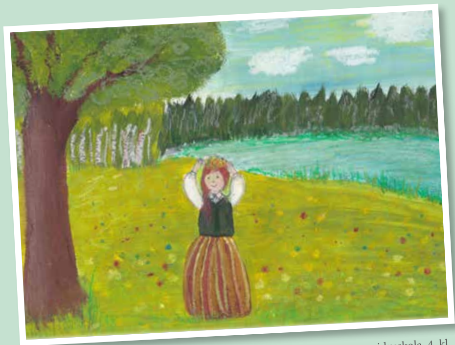
DANIELA AGLENIECE, Kārsavas vidusskola, 4. kl.