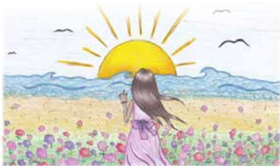
UNA UPENIECE, Maltas vidusskola

Annija Estere Slesere, Kārsavas vidusskola, 5. kl.